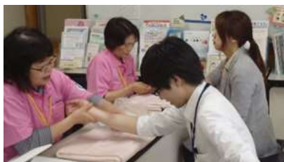
写真：看護師さんによるハンドマッサージ