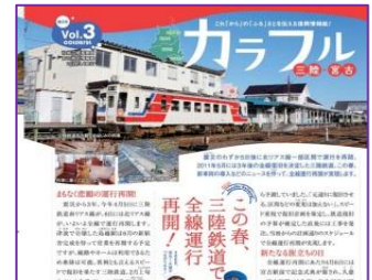
カラフル三陸・宮古

※当センターに復興情報誌「カラフル三陸・宮古」が届いています。お持ち帰りいただけますので、どうぞご利用ください。