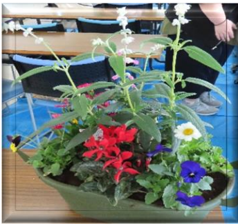
花の特徴や植え方のポイントのアドバイスを受けての完成品です