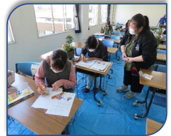
相馬野馬追絵付け体験