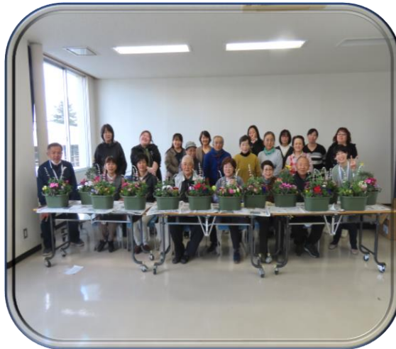
皆さん、寄せ植えの完成品と一緒に集合写真を撮る。写真うつりもgoodです