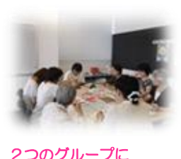
2つのグループに分かれて作業