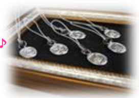
できた！世界でひとつだけ！しかも、焼成すると純銀99・9%なんですって