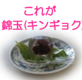
これが錦玉(キンギョク)♪