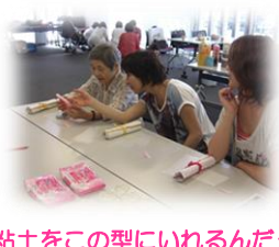
「粘土をこの型にいれるんだって。これがいいかな？」