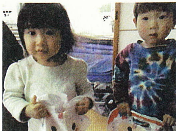
～クリスマス交流会の様子～