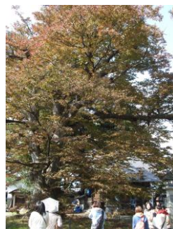
白山神社の大ケヤキ