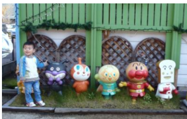
白山神社の途中にある、保育園前でパシャリ！！