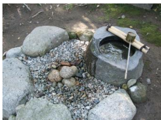
水琴窟(水を垂らすと琴のような音がする)