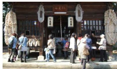
長遠寺仁王堂の大わらじ