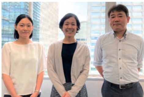
(左から鹿兒嶋調査官、久保田調査官、今津調査官)