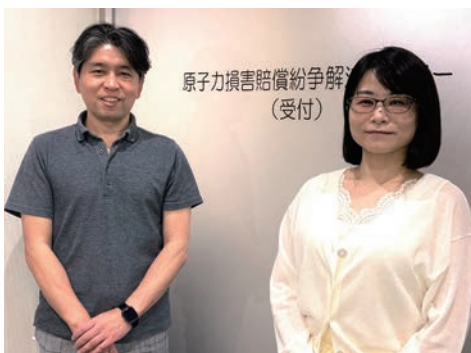
(左から近藤次長、峰調査官)