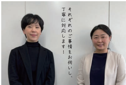
(左から朴調査官、筒井調査官)