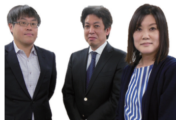
(左から、松井室長補佐、堀内調査官、杉田調査官)